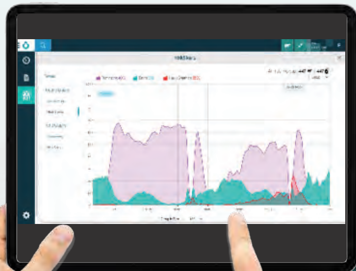
暑熱ストレスグラフ▶